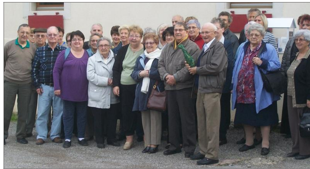
■ Une petite pause à la sortie de la cave d'un viticulteur d'Orschwihr.

Les retraités de l'amicale Contacts retraite infos (CRI) de Beaucourt et environs et les décorés du travail organisent désormais leurs voyages et séjours ensemble. Ils se sont retrouvés pour une escapade en Alsace à la découverte de la région et de ses spécificités.